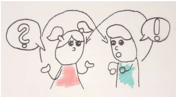
Graphik: Emma Berger

Alternative Integrations- und Kommunikationskonzepte